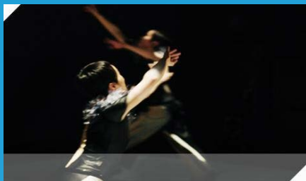
ZERO ONE by Yasuko Yokoshi