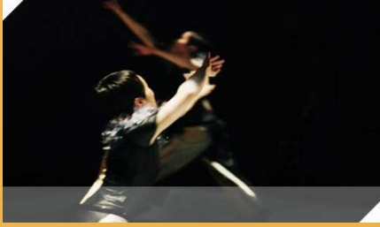
ZERO ONE by Yasuko Yokoshi