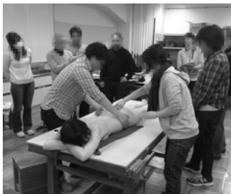
不明な部位は触って覚えます。